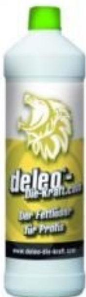
deleo® viskozais attaukotājs